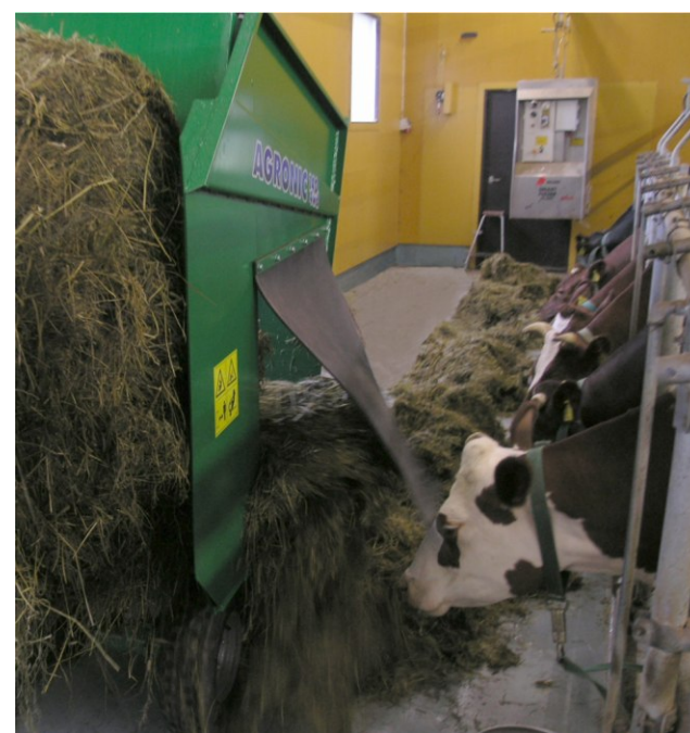
Paali puretaan suoraan eläinten eteen, nopeasti ja pölyttömästi.