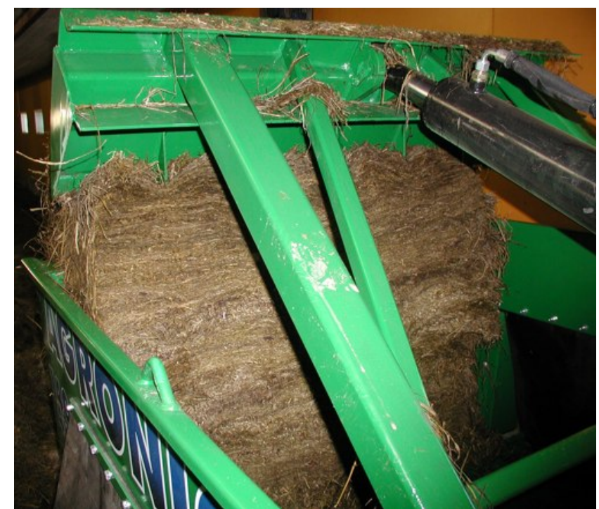
Leikattavan viipaleen koko on säädettävissä. Poikittaiset terät leikkaavat sen jopa kuuteen osaan. Voima riittää tarvittaessa jäätyneenkin rehun leikkaukseen.