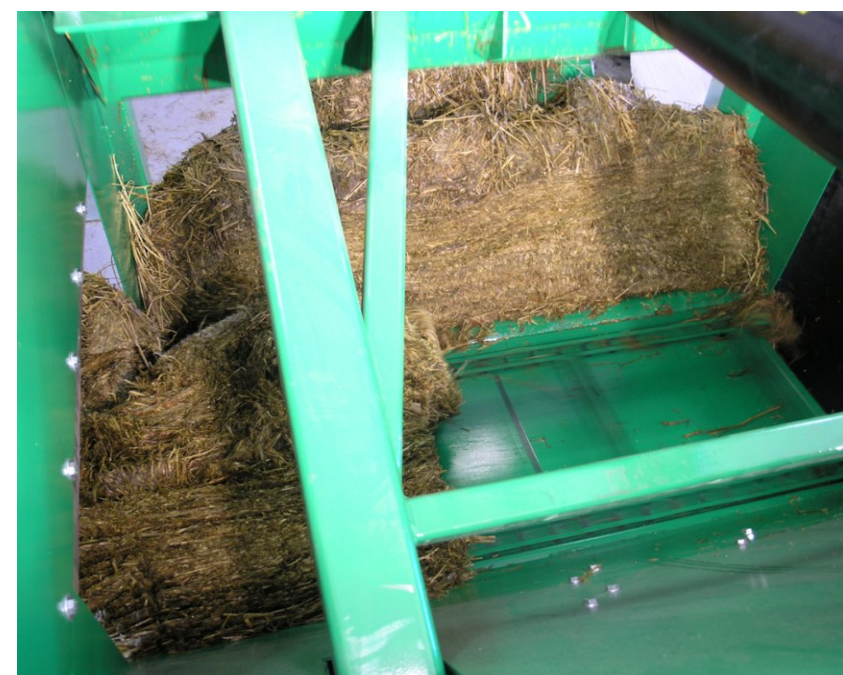
Poikittaiskuljettimen aukko on riittävän suuri, jotta isokin pala sopii takertelematta tulemaan ulos. Kuljetinta voidaan ajaa molempiin suuntiin. Kuljetin on vahvaa Kolswa 74 ketjua.