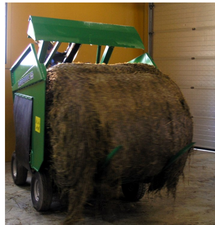
Paali on nostimessa koko työkierron ajan. Nostinta korkeus määrää leikattavan palan suuruuden. Nostimen rakenteesta johtuen paali voidaan myös poistaa siitä tarvittaessa. Nostimeen on saatavissa lisäpiikkejä irtorehua varten.