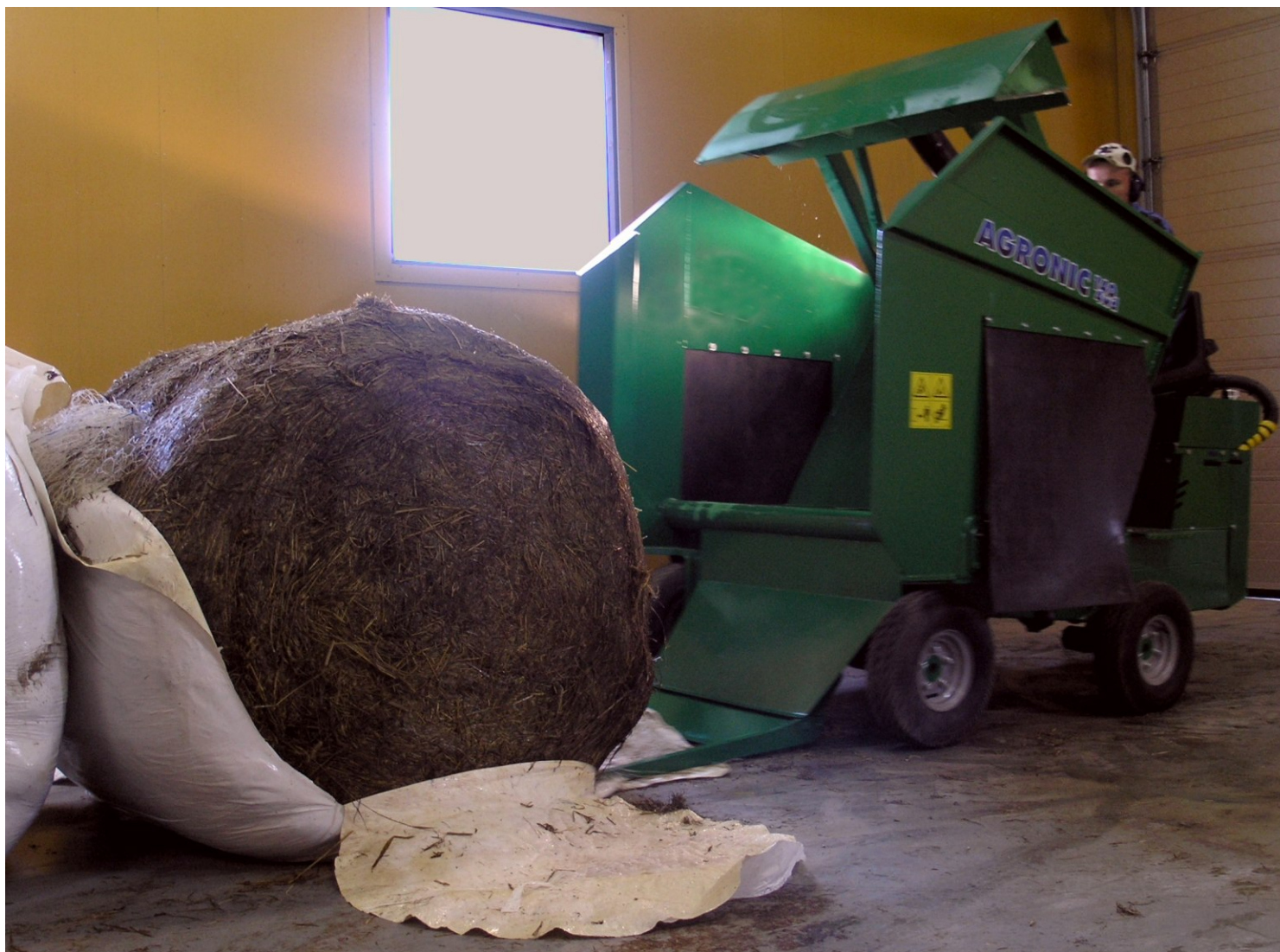
Muovi ja verkko avataan ennen lastausta. Nelivedon ansiosta nostimen piikit menevät paalin alle ilman erityisjärjestelyitä. Paali nostetaan ylös, jolloin se kääntyy niin, että alla olleet muovit on helposti poistettavissa.