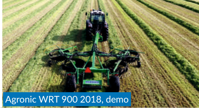
Agronic WRT 900 2018, demo

Katso muut ajantasaiset myytävät vaihto- ja esittelykoneet: Linkki valikoimissa tällä hetkellä mm. karhottimia, paalinkäärimiä, ACC PulseM ja AMS paalaimia. Myös rahoituksella.