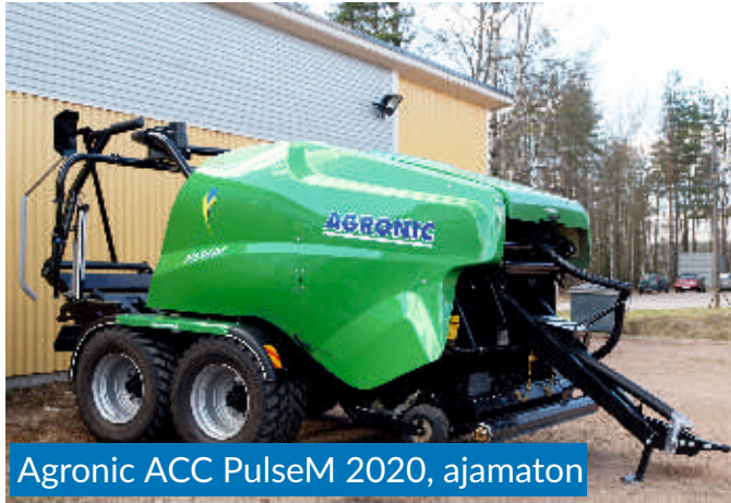
Agronic ACC PulseM 2020, ajamaton