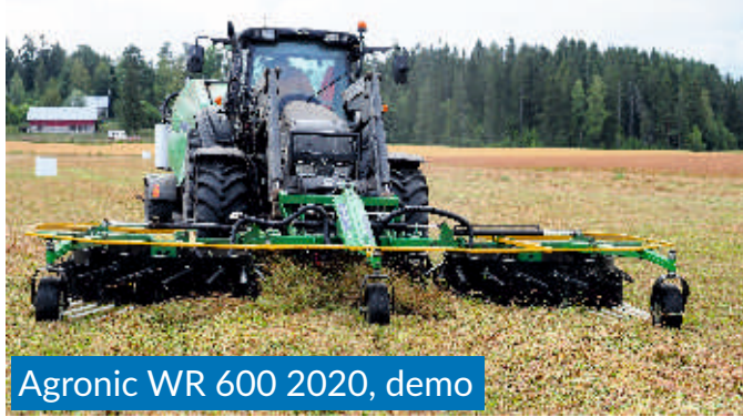
Agronic WR 600 2020, demo