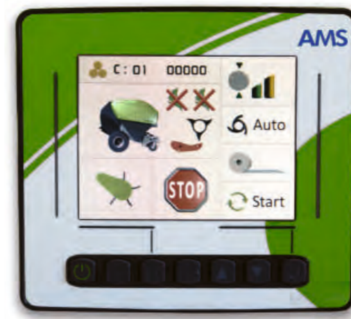
Affichage facile à utiliser pour l'Agronic AMS. Le nombre de couteaux sélectionnés et la montée/descente de la cassette à couteaux. Réglage de la compression de la chambre de compression avec trois réglages préprogrammés. L'achèvement de la balle est indiqué par un écran couleur et un avertissement sonore. Reliure filet automatique ou manuelle. Le compteur de balles, les balles/heure, le nombre total de balles et le nom du champ/client peuvent être stockés en