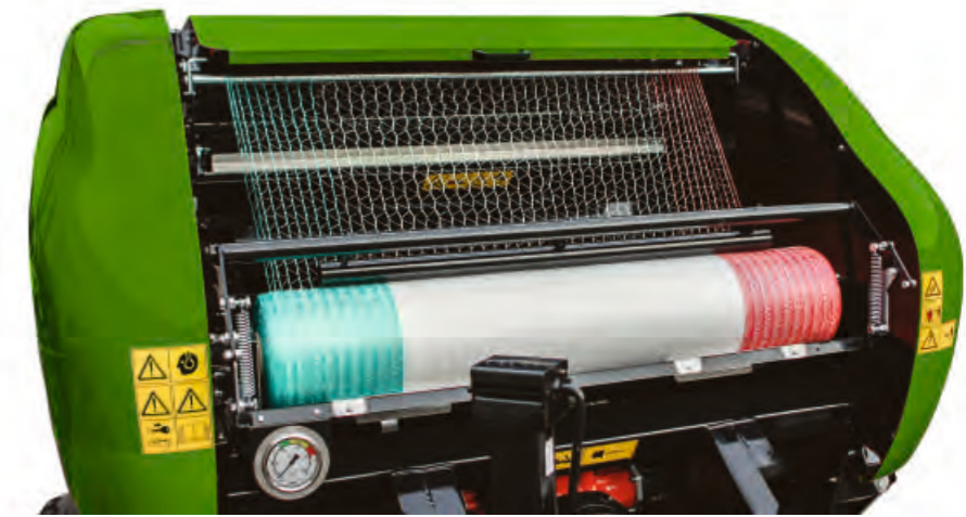
Grand compartiment facilement accessible pour le filet, pouvant accueillir des rouleaux de largeurs de 1230 à 1330 mm (4' et 4' 3"). Indicateur de volume net mécanique et réglage du frein mécanique. Conception fiable et changement facile des rouleaux de filet. Support pour deux rouleaux de filet et une faible hauteur de chargement des rouleaux.