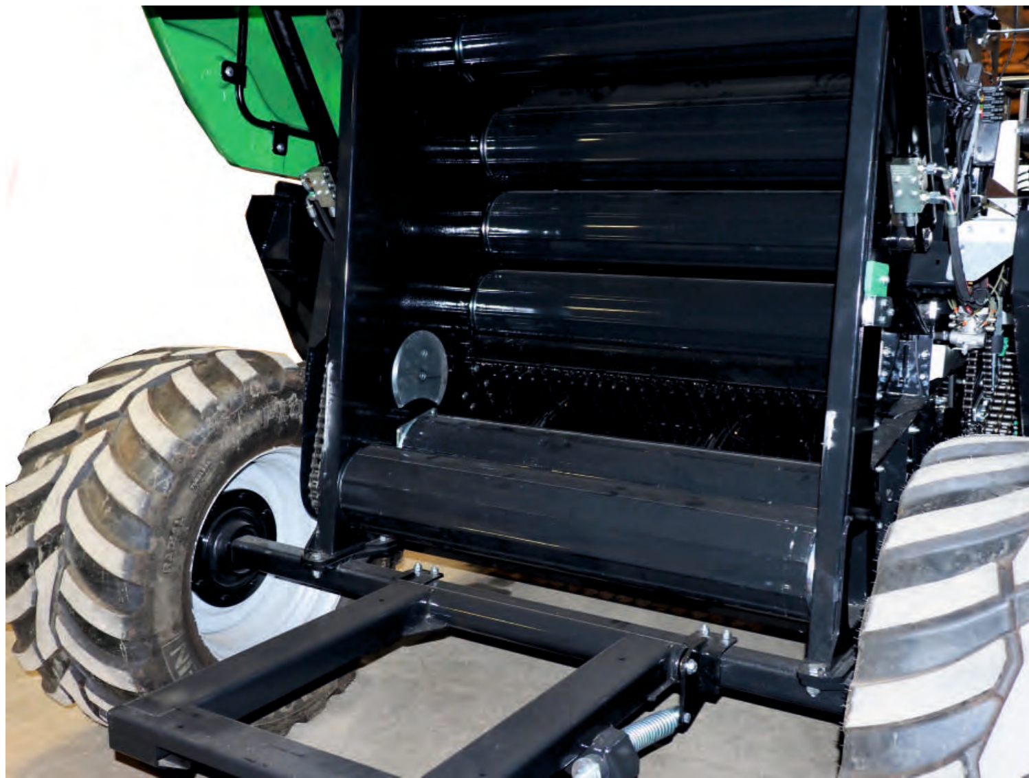
Commande électrohydraulique de la pression de la chambre de compression depuis la cabine du tracteur. Les 18 rouleaux robustes, avec plaques de traction et de guidage, assurent la rotation des balles dans toutes les conditions. Pression de balle optimale avec des exigences de puissance inférieures à la normale.