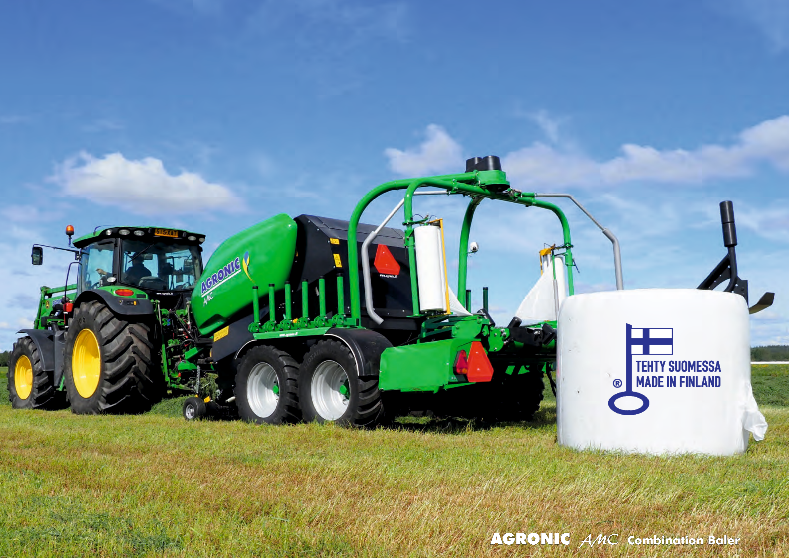
AGRONIC AMC Combination Baler