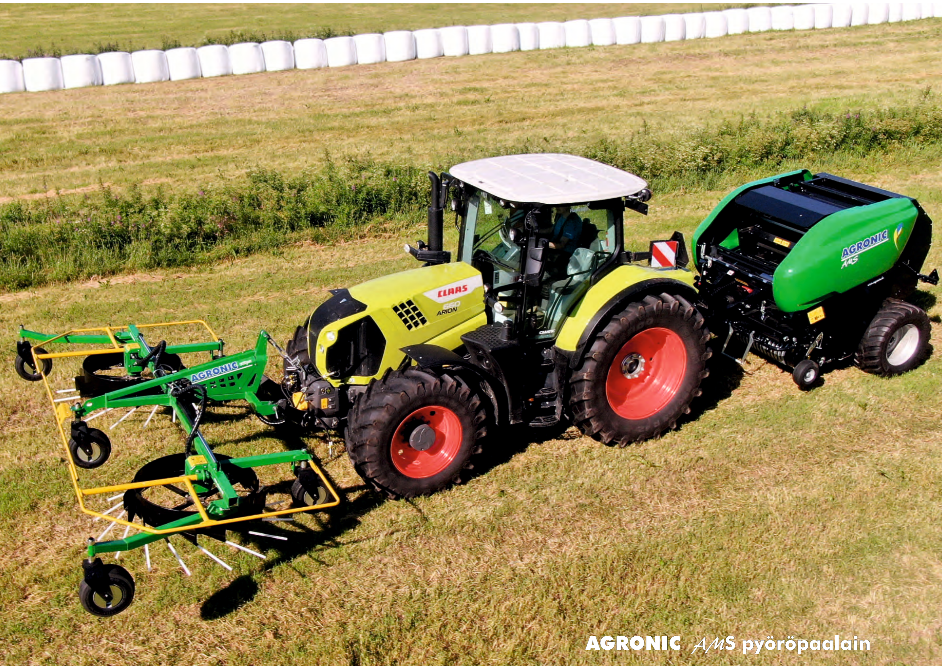
AGRONIC AMS pyöröpaalain